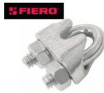
NUDO "FIERO" PARA CABLE, de hierro maleable, acabado galvanizado. Exceden la norma: Esp. Federal FF-C-450C