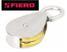
GARRUCHA "FIERO" PARA NORIA, conocidas tambien como poleas para tendadero, con acabado niquelado.