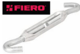
TENSOR "FIERO" ZINC GANCHO - GANCHO, ACABADO GALVANIZADO.