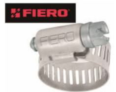
ABRAZADERA REFORZADA "FIERO" (Chica y Grande) Fabricadas en acero inoxidable serie 300 de mayor durabilidad. Bolsa con 10 piezas. Calidad Automotriz.