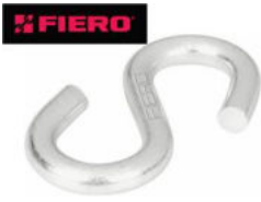
GANCHO "S" "FIERO" PARA CABLE, acabado galvanizado.